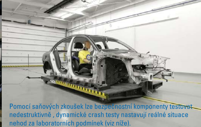
Pomocí saňových zkoušek lze bezpečnostní komponenty testovat nedestruktivně, dynamické crash testy nastavují reálné situace nehod za laboratorních podmínek (viz níže).